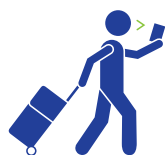
CHECK-IN PELO CELLULAR

Estamos potencializando nossa gestão de identidade e recursos, aplicando-os em toda a jornada do passageiro