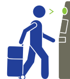
CHECK-IN COM AUTOATENDIMENTO