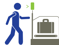
DESPACHO DE BAGAGEM AUTOMÁTICO